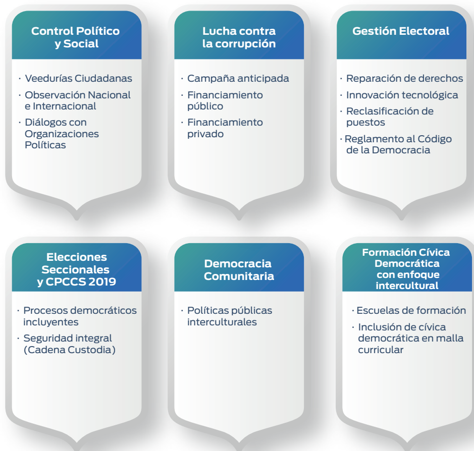
Gráfico 2: Ejes de reinstitucionalización

Uno de los principales objetivos del Consejo Nacional Electoral es recuperar la ética en la gestión pública y privada y; principalmente, recobrar la confianza del pueblo en este órgano electoral, clave para el funcionamiento de la democracia y vigencia plena de los derechos de participación política, expresado en seis ejes de trabajo que representan los nuevos desafíos del CNE, descritos en el siguiente gráfico: