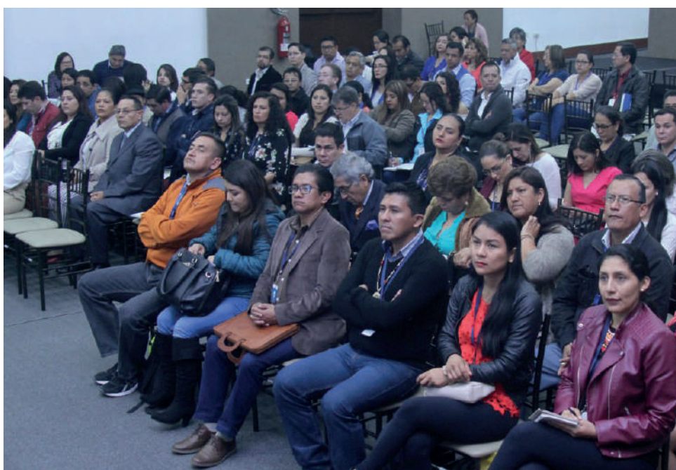
Taller con Directores Provinciales Electorales

Aplicando el principio de paridad que establece el Código de la Democracia, las 24 Juntas Provinciales Electorales y la Junta Especial del Exterior se encuentran conformadas en un 49% de mujeres y 51% de hombres.