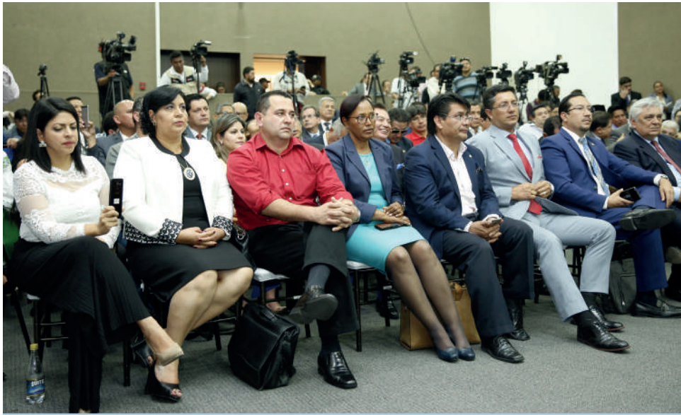
Candidatas y candidatos al CPCCS

El Consejo Nacional Electoral procede a dar cumplimiento al mandato del pueblo, expresado en las urnas, conforme lo establece la Ley Orgánica Reformatoria a la Ley del Consejo de Participación Ciudadana y Control Social, en el Art. 19 en su parte pertinente manifiesta: “el CPCCS será elegido por sufragio universal, directo, libre y secreto, conforme al régimen de elecciones establecido en esta Ley”.