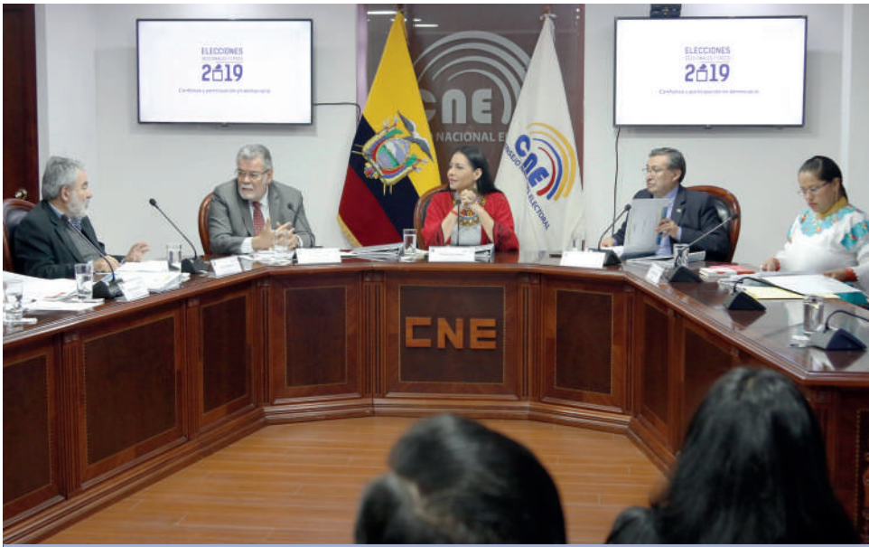
Pleno del Consejo Nacional Electoral

En este proceso electoral se elegirán 11.069 autoridades entre principales y suplentes, a escala nacional.