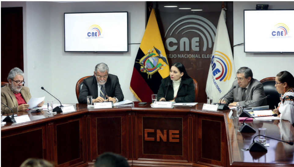
» Pleno del Consejo Nacional Electoral

El diálogo y la capacidad de escucha serán las herramientas irremplazables para reconstituir el Consejo Nacional Electoral. Es necesario, volcar todos los esfuerzos para que los partidos, movimientos y más actores políticos y sociales sientan que se construye un sistema electoral sólido, condición necesaria para que el país supere el atraso económico y las desigualdades sociales.