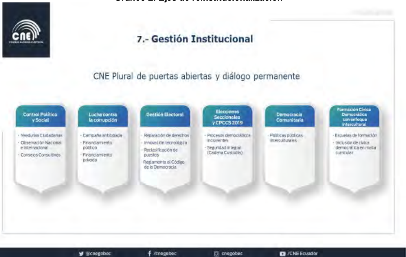
Gráfico 2: Ejes de reinstucionalización

Uno de los principales objetivos del Consejo Nacional Electoral es recuperar la ética en la gestión pública y privada y; principalmente, recobrar la confianza del pueblo en este órgano electoral, clave para el funcionamiento de la democracia y vigencia plena de los derechos de participación política, expresado en cinco ejes de trabajo que representan los nuevos desafíos del CNE, descritos en el siguiente gráfico: