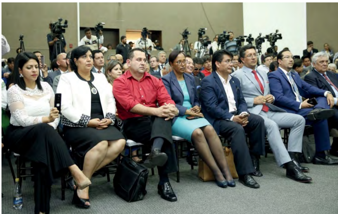
Candidatas y candidatos al CPCCS

El Consejo Nacional Electoral procede a dar cumplimiento al mandato del pueblo, expresado en las urnas. En el Art. 19 en su parte pertinente manifiesta: “ el CPCCS será elegido por sufragio universal, directo, libre y secreto, conforme al régimen de elecciones establecido en esta Ley ”.