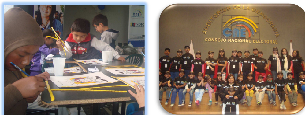
Figura 13. Taller Vacacional