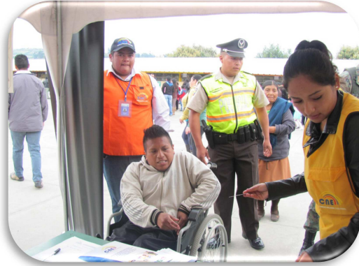
Figura 5. Mesa de atención preferente