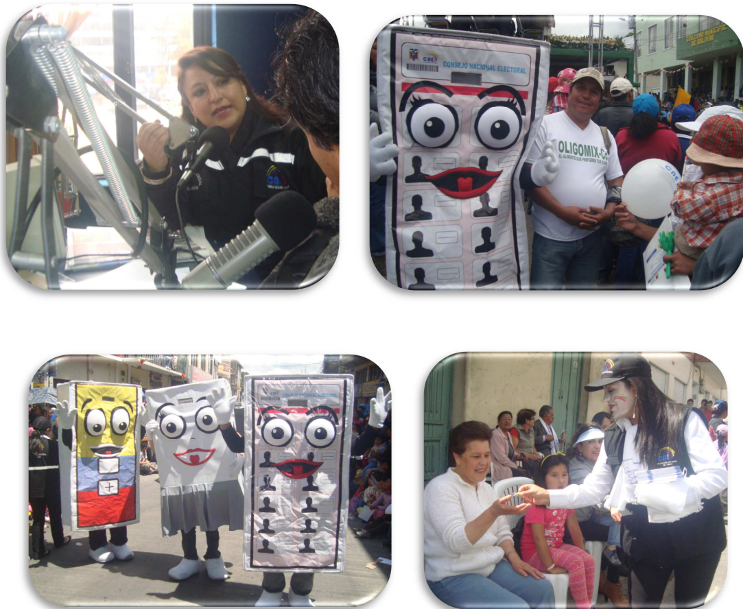
Figura 2. Medios de comunicación