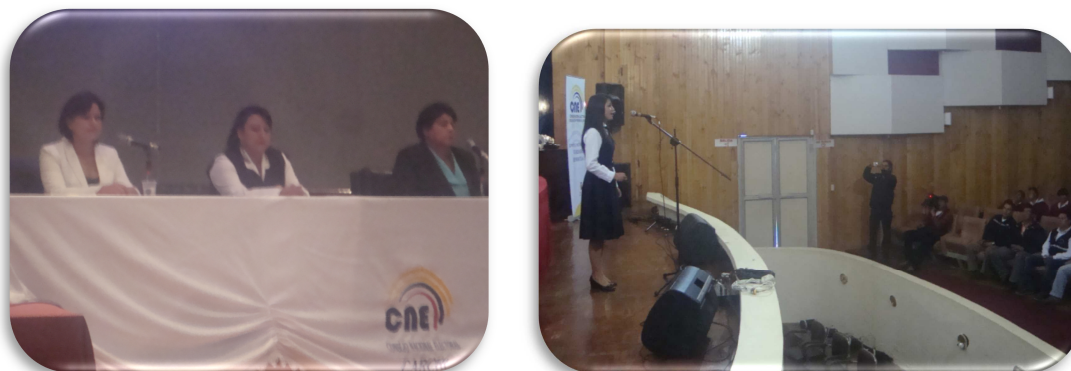
Figura 15. Participación Política de las Mujeres