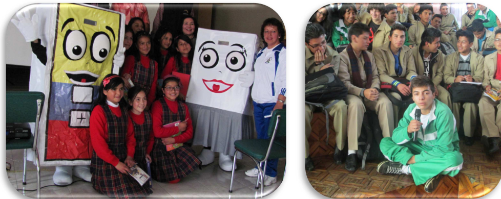
Figura 9. Foros Unidades Educativas