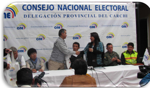
Figura 3. Observadores

En este proceso electoral se presentaron ante la Junta Provincial Electoral 1 impugnación a los resultados electorales y contó con 12 observadores locales y 4 observadores internacionales representantes de los países de Perú, Venezuela, Bolivia y UNASUR.