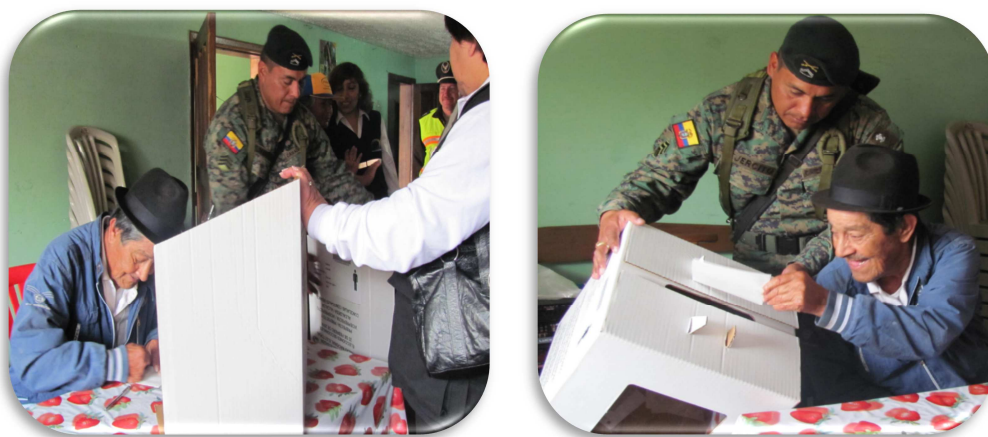
Figura 4. Voto en Casa