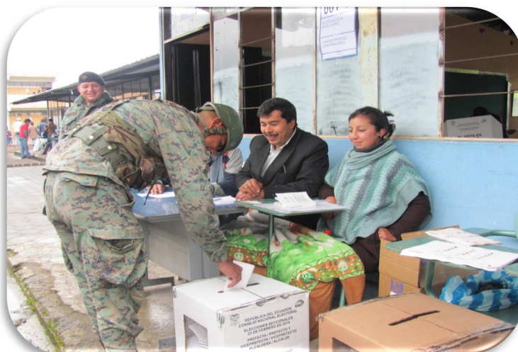
Figura 7. Sufragantes Fuerzas Armadas