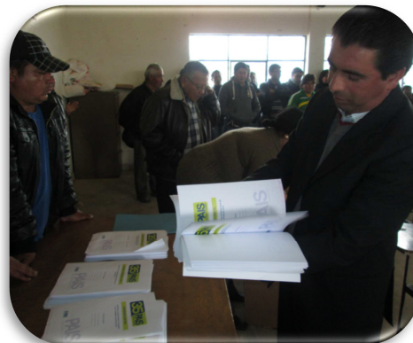
Figura 14. Capacitaciones a Organizaciones Políticas