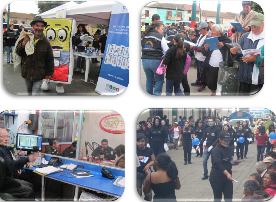
Figura 8. Feria de la Democracia