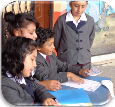
Figura 11. Procesos Electorales Estudiantiles