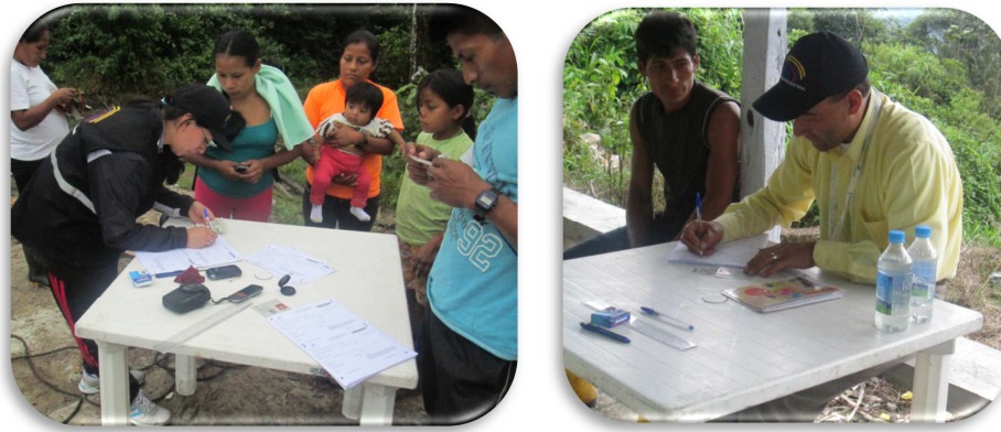
Figura 1. Zonas Electorales creadas (San Marcos – El Baboso)