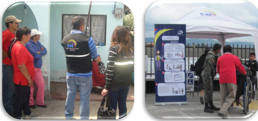
Figura 16. Participación de Personas con Discapacidad