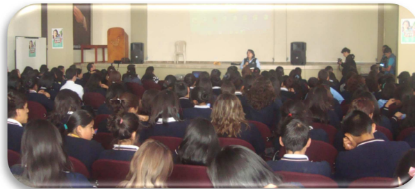
Figura 6. Sufragantes de 16 a 18 años