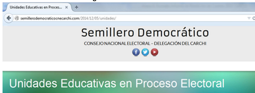
Figura 12. Taller Vacacional