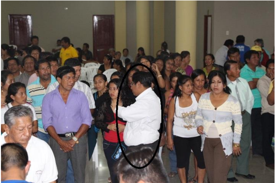
Delgado de una de las listas sacando las papeletas