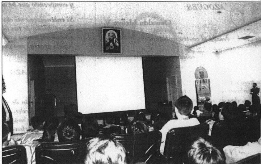
La formación cívica a estudiantes de los planteles educativos de la provincia.

Asimismo, el CNE-Cañar, realizó cine foros en establecimientos educativos de la provincia, donde se proyectó el documental “La muerte de Jaime Roldós”.