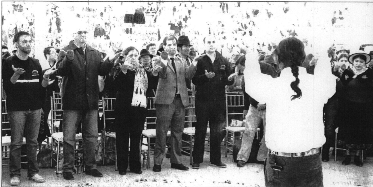
Voces Diversas congregó a cinco provincias de la Zona 4 del CNE, evento desarrollado en Ingapirca.