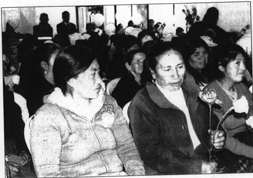
Mujeres rurales de la parroquia San Miguel.