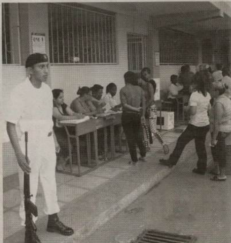
COMPENSACIÓN. Los miembros de las juntas receptoras del voto que no hayan cobrado su compensación, deben hacerlo hasta mediados de diciembre.

que con tiempo haga sus trámites de cambio de domicilio y no esperar a que venga un nuevo proceso para recién hacerlo", manifestó la funcionaria.