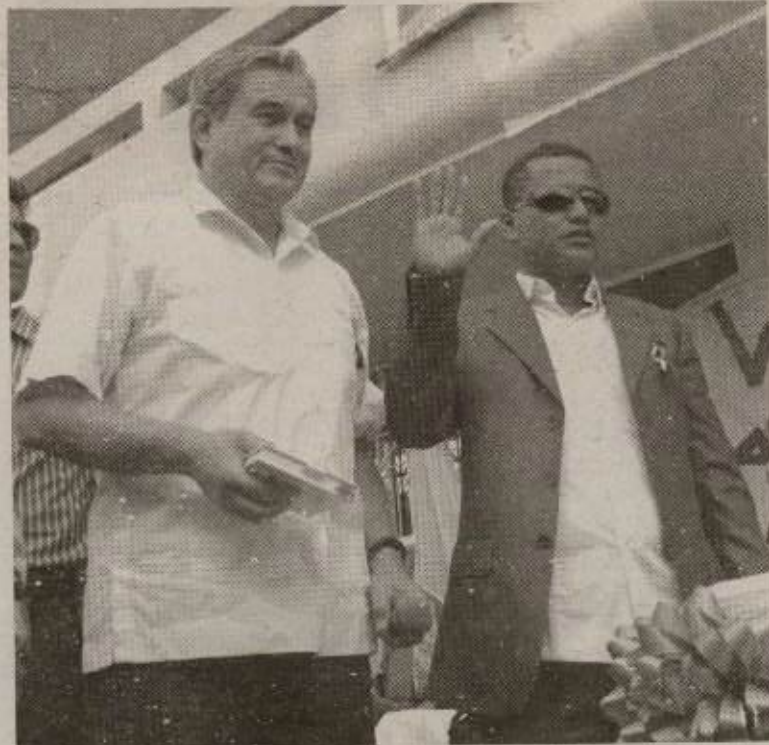
LEGALIDAD. Dos juramentos formalizaron la posesión del nuevo alcalde del cantón Muisne, Eduardo Proaño Gracia, el presidente del Consejo Nacional Electoral (CNE), Domingo Paredes, se encargó de ello.

Una vez posesionado en el cargo de alcalde, Eduardo Proaño Gracia anunció que posteriormente