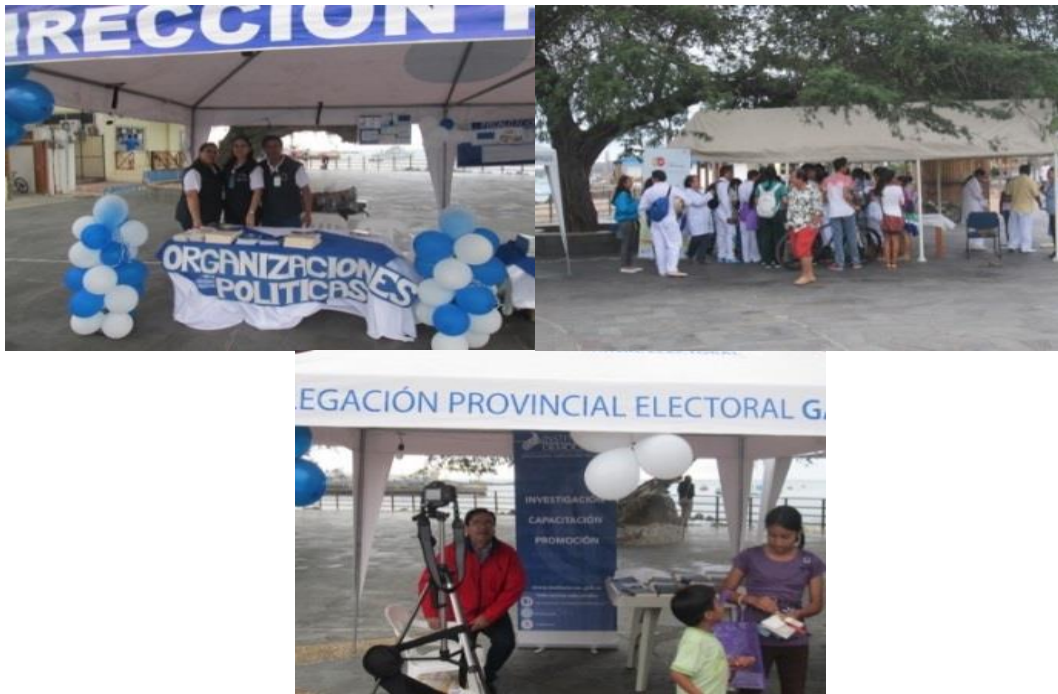
Fotografía 5: Feria de la Democracia

OE3: Incrementar el ejercicio permanente de los derechos de participación política con criterios de inclusión, participación y equidad en las organizaciones políticas para robustecer la democracia y el poder ciudadano.