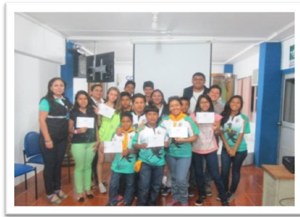
Fotografía: 2 Capacitación a Jóvenes del Club “Conquistador”