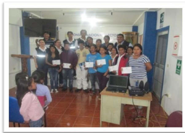
Fotografía 3: Capacitación a Comunidad Salasaca