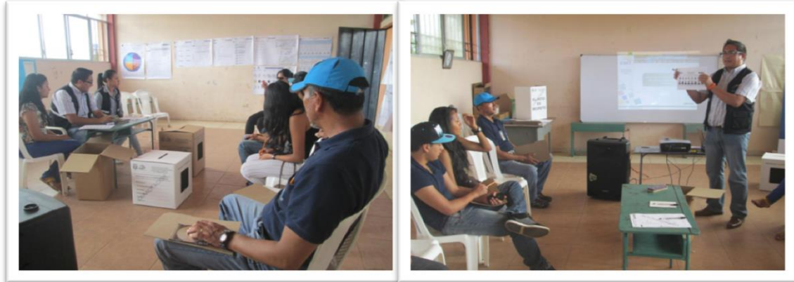
Fotografía 4: Capacitación a Miembros de Juntas Receptoras del Voto

0 Ciudadanía, 0 Servidores electorales 0 de autoridades electas 445 MJRV capacitados