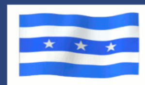
Provincia del Guayas