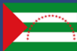
Provincia de Manabí

¿A qué jurisdicción provincial quiere usted que pertenezca el sector denominado "La Manga del Cura"?