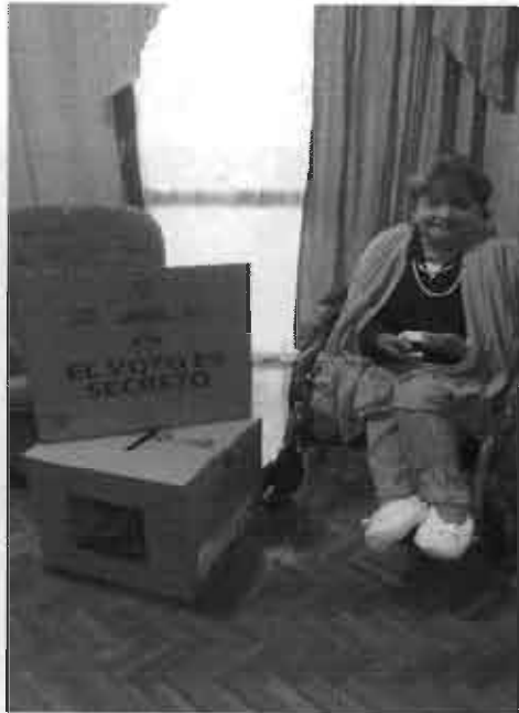
Fotografía N° 4