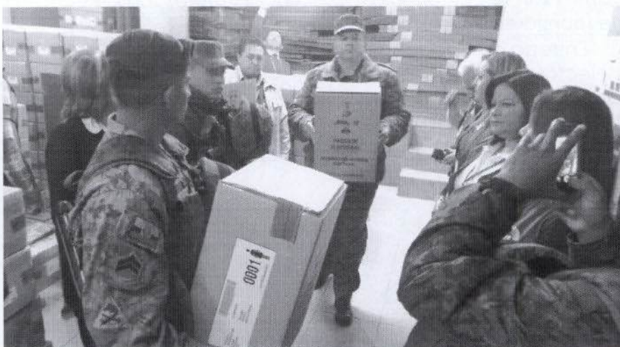
Fotografía N° 1