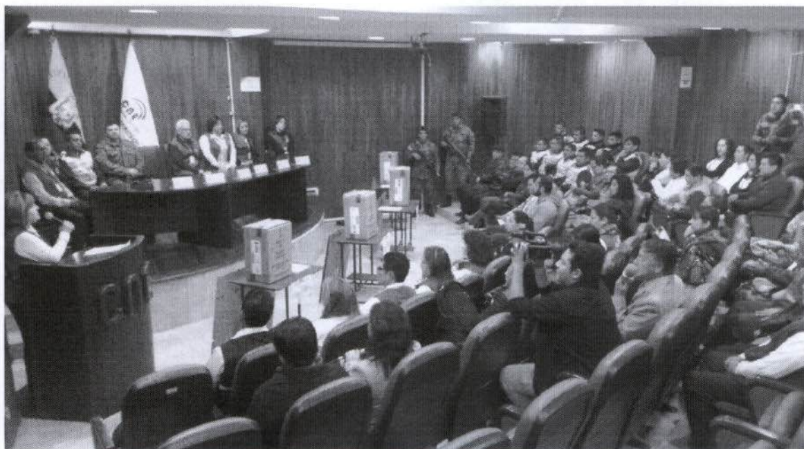
Fotografía N° 3