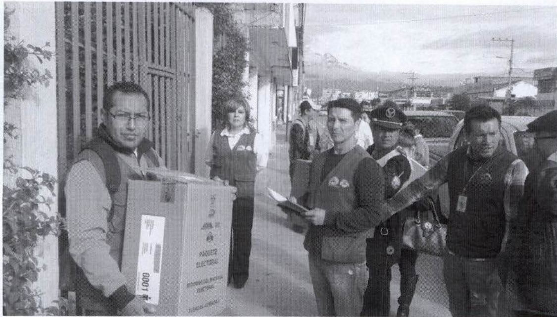
Fotografía N° 5