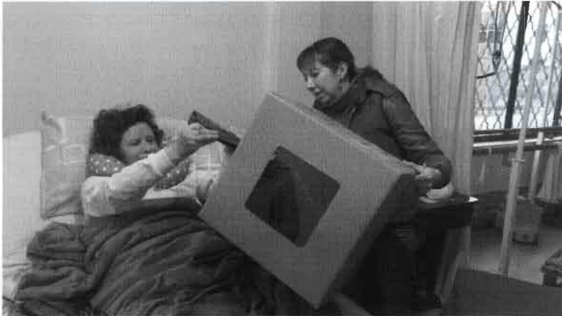
Fotografía N° 6