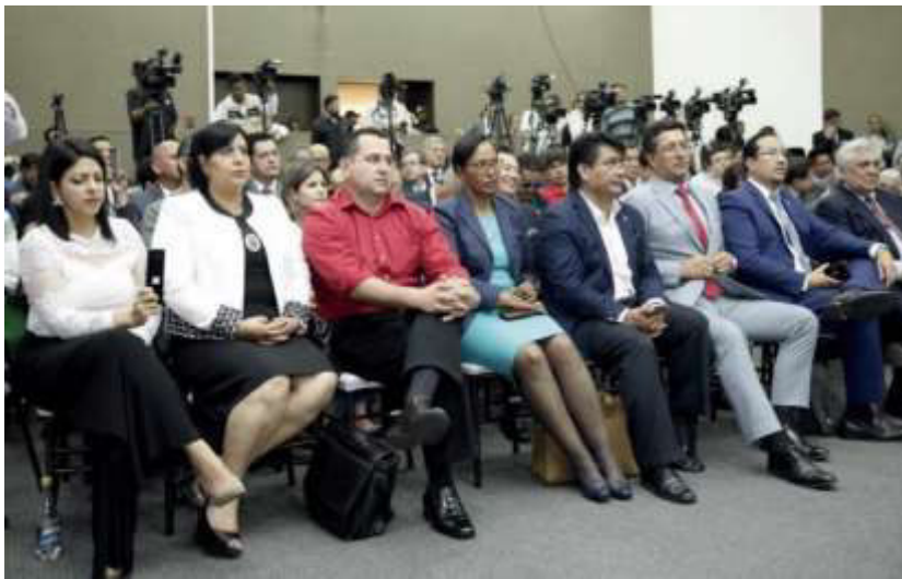
Candidatas y candidatos al CPCCS

El Consejo Nacional Electoral procede a dar cumplimiento al mandato del pueblo, expresado en las urnas. En el Art. 19 en su parte pertinente manifiesta: “el CPCCS será elegido por sufragio universal, directo, libre y secreto, conforme al régimen de elecciones establecido en esta Ley” .