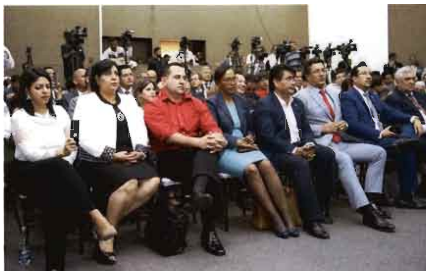
Candidatas y candidatos al CPCCS

El Consejo Nacional Electoral procede a dar cumplimiento al mandato del pueblo, expresado en las urnas. En el Art. 19 en su parte pertinente manifiesta: “el CPCCS será elegido por sufragio universal, directo, libre y secreto, conforme al régimen de elecciones establecido en esta Ley”.