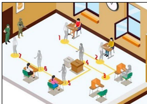
A: Esquema para aulas